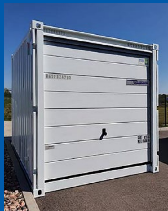
Porte de garage sectionnelle pratique